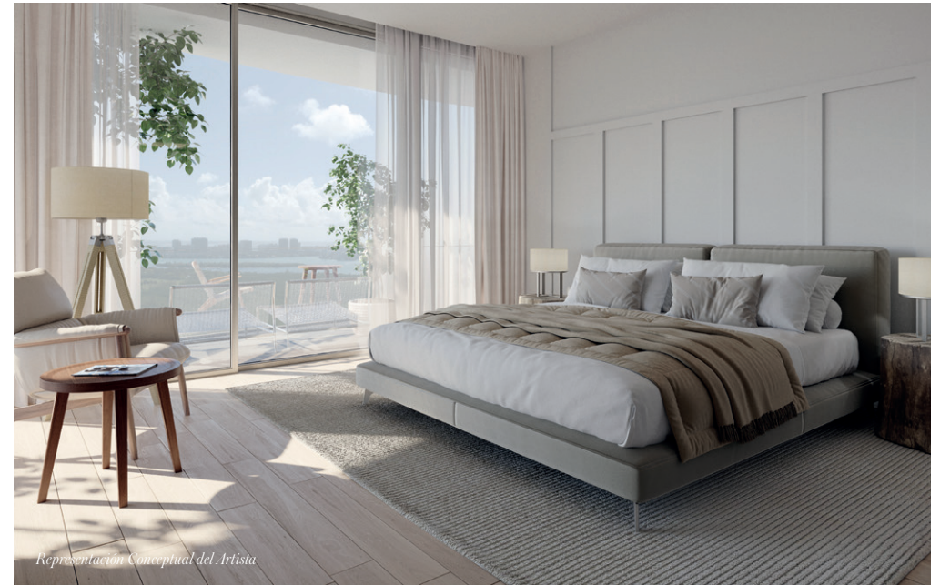
Representación Conceptual del Artista

Interiores elegantemente diseñados por Meyer Davis Studio con impresionantes vistas panorámicas del Océano Atlántico, Biscayne Bay, el Parque Estatal Oleta River, el horizonte de Miami y la Laguna SoLé de siete acres. Espaciosas plantas totalmente acabadas con techos de más de 9 pies de altura que se abren a una gran planta privada acabada, balcones envolventes con barandillas de cristal para una vida interior-exterior sin interrupciones.