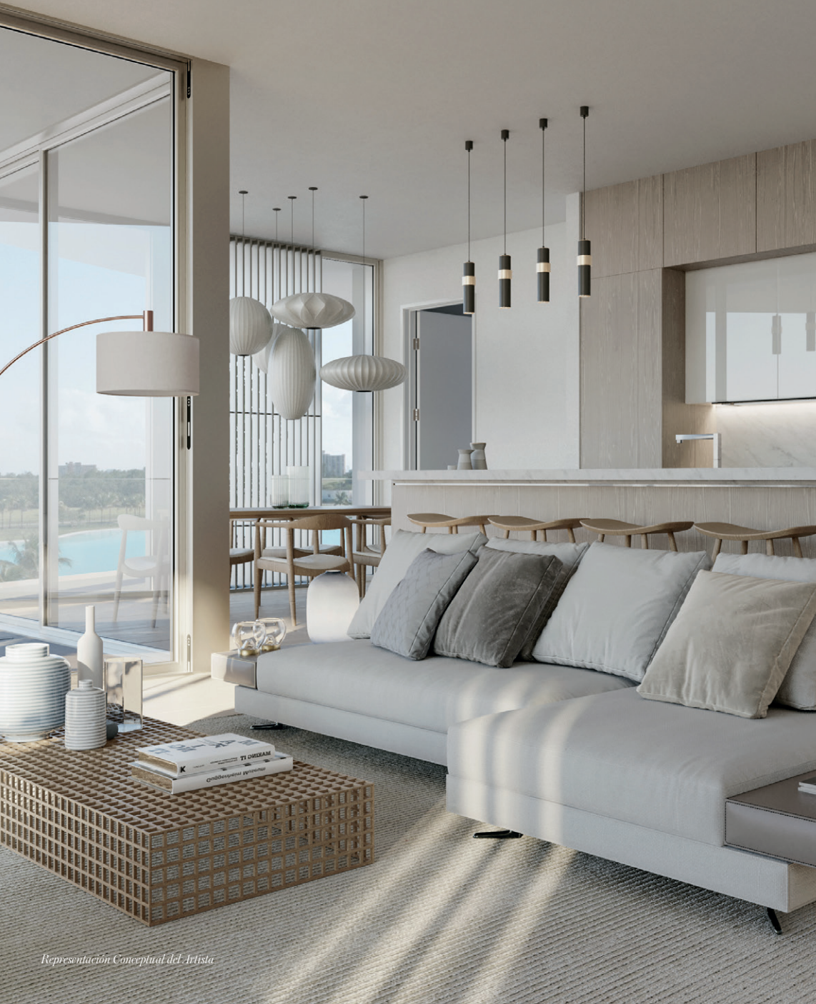
Representación Conceptual del Artista

Las paredes con ventanas del piso al techo permiten abundante luz natural en todas partes, iluminando los interiores de los condominios de Meyer Davis Studio con acabados de diseñador en una paleta suave y neutra.