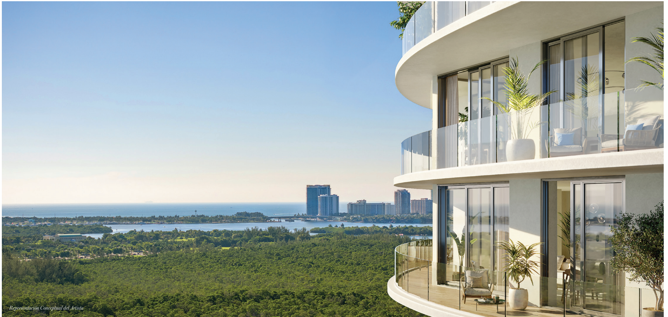
Representación Conceptual del Artista