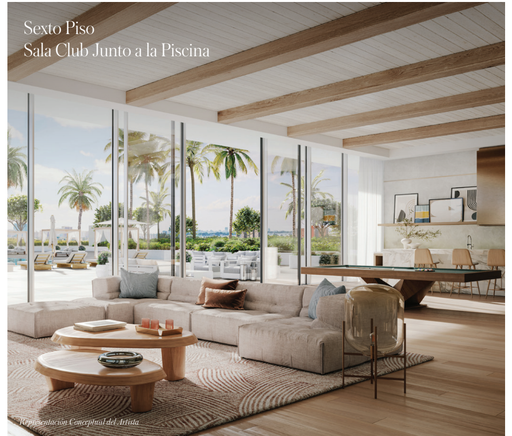
Sexto Piso Sala Club Junto a la Piscina