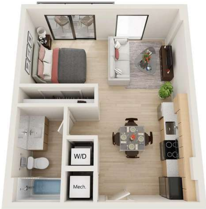
Renderings are an artist's conception and are intended only as a general reference. Features, materials, finishes and layout of subject unit may be different than shown. 3DPlans.com