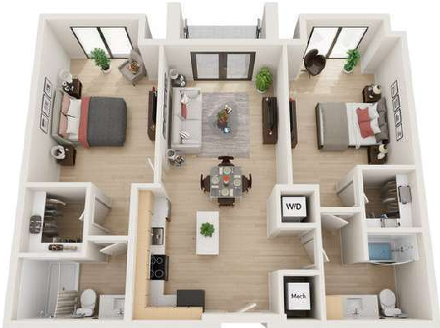
Renderings are an artist's conception and are intended only as a general reference. Features, materials, finishes and layout of subject unit may be different than shown. 3DPlans.com