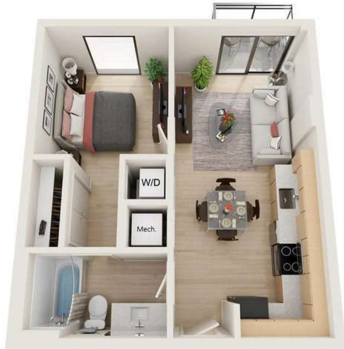
Renderings are an artist's conception and are intended only as a general reference.