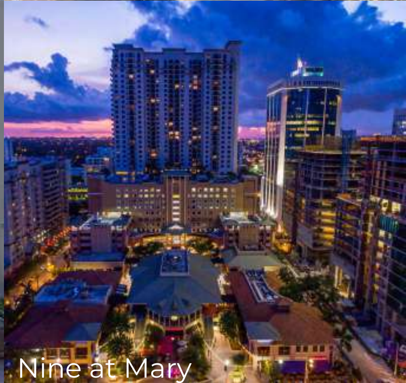
Nine at Mary